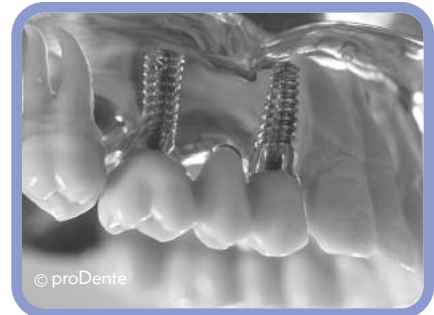
Abb.: Oberkiefer, Brückenkonstruktion auf zwei Implantaten befestigt